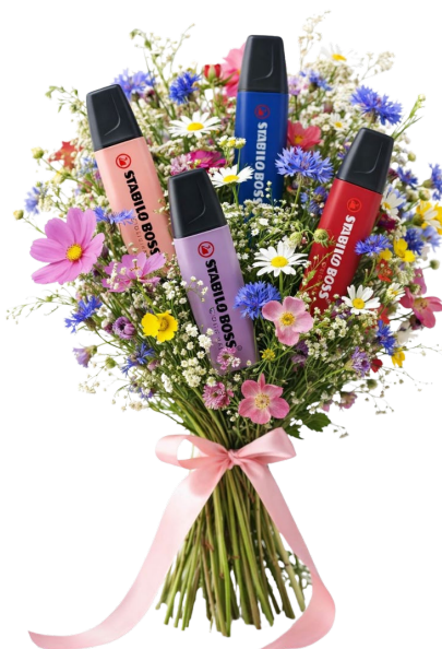
Visuel généré par IA

La Wildflower Edition de STABILO Promotion Products active la communication de marque grâce à des couleurs tendance expressives et transforme des instruments d'écriture éprouvés en supports publicitaires personnalisables qui attirent l'attention et ont une présence durable dans la vie quotidienne.